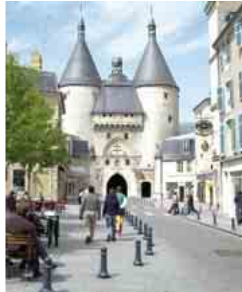
La plus ancienne porte de la ville : la porte de la Craffe

Mise à disposition d'un guide durant 1 h 30 pour une visite en français en journée 63€ (hors dimanche et jours fériés)